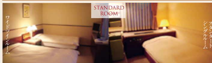
スタンダードルーム

靴を脱いで、裸足でくつろいでいただける部屋です。色調を上質で落ち着いた色に、さらには、間接照明で心身を和ませてくれます。壁には自然素材の珪藻土を使用しています。