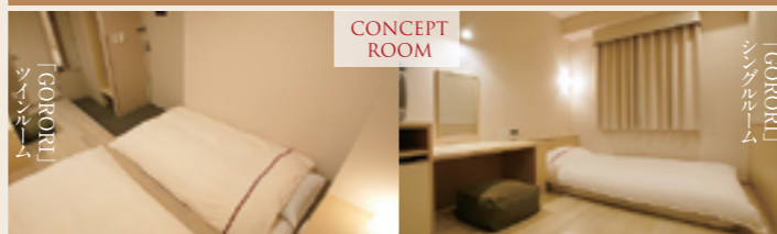
コンセプトルーム