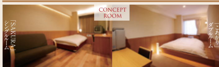
コンセプトルーム

日本人本来の生活スタイルである「床に座る」。そんな暮らしをホテルで再現し、実感できるお部屋です。内装は、やさしさや温かさを感じられる色、素材で構成しました。